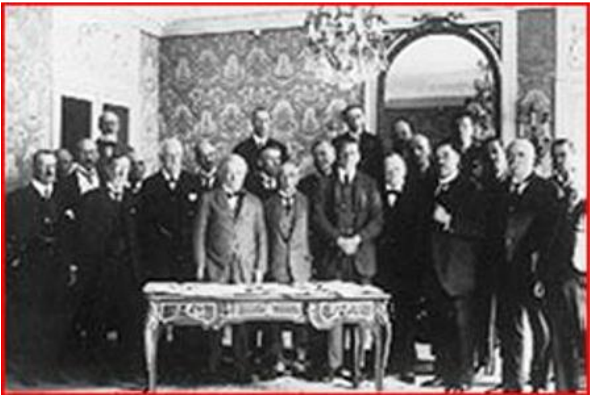
Սերի խաղաղութեան պայմանագրի մասնակիցները