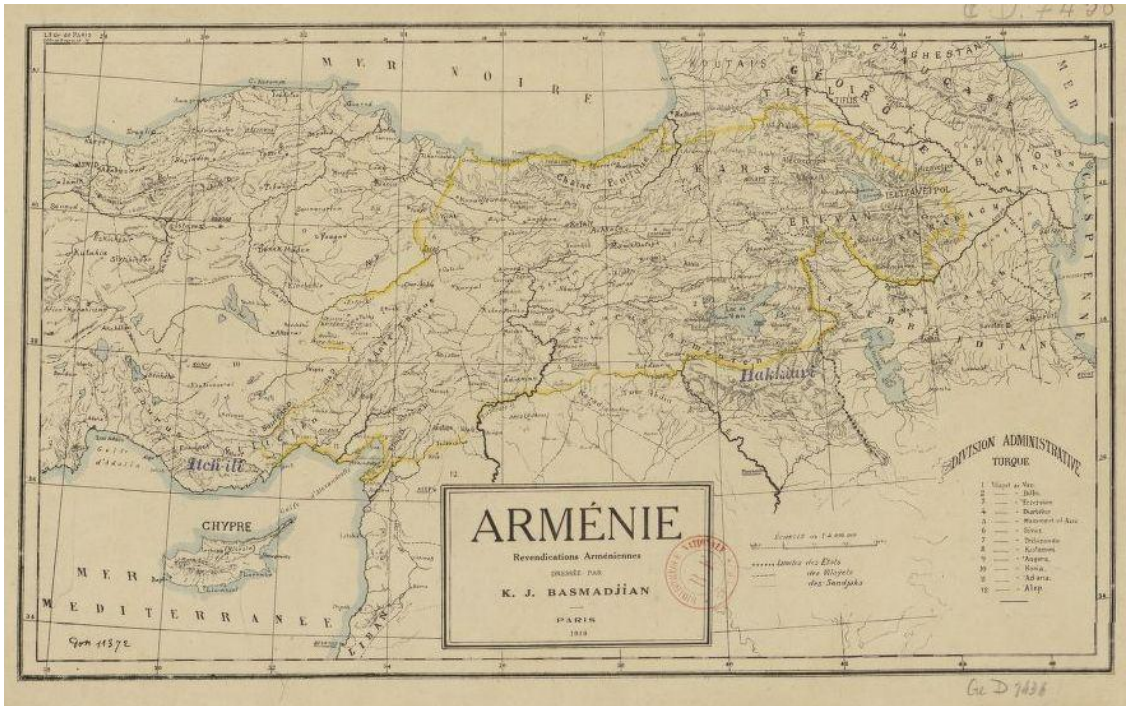
Հայաստանի ազգագրական քարտեզը