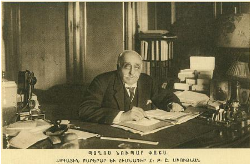
Արեւմտեան Հայաստանի Ազգային Խորհուրդի Նախագահ Պօղոս Նուպար