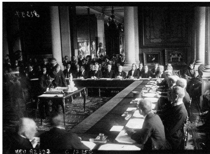
Թիւրքական պատուիրակութիւնը իր ստորագրութիւնը կը դնէ Մէրի խաղաղութեան պայմանագրի տակ